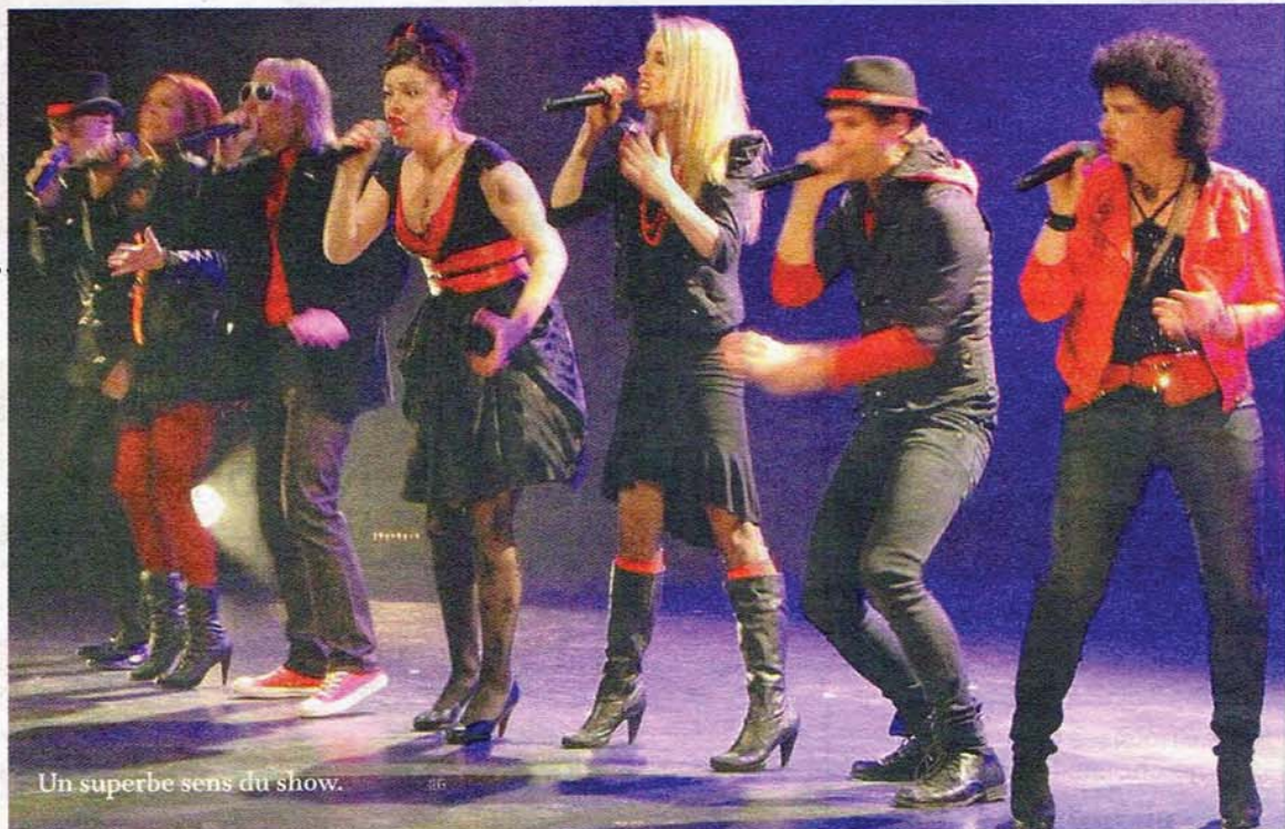
Un superbe sens du show. JLG