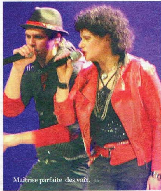
Maîtrise parfaite des voix. JLG