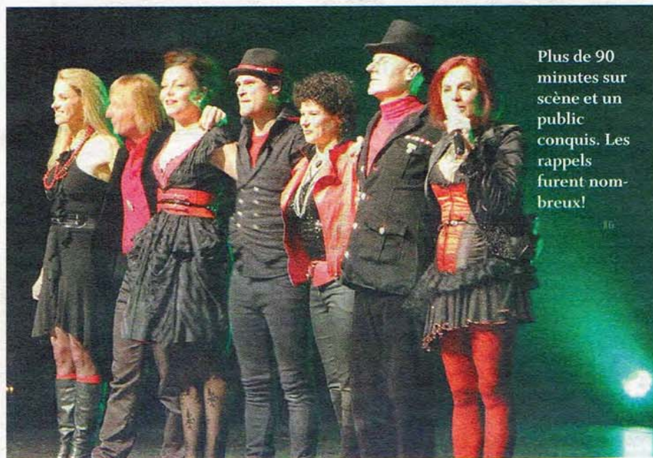
Plus de 90 minutes sur scène et un public conquis. Les rappels furent nombreux! JLG