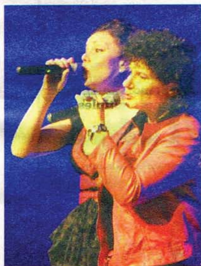
Parfaite harmonie entre les voix. JLG

groovy dans d'autres, mais d'une parfaite harmonie. Caféclope, musicien créatif, s'impose sur scène comme aucun autre batteur vocal. La création musicale de Frelon Vert fait merveille au sein de Voxset. Quant à Mister B, aujourd'hui plus que hier et moins que demain, peut-être fier d'avoir créé le concept de 4 voix féminines pour les harmonies, et 3 hommes pour le rythme et la basse.